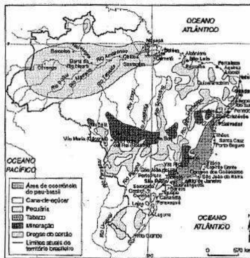
Brasil: a economia no século XVIII e a produção do espaço geográfico