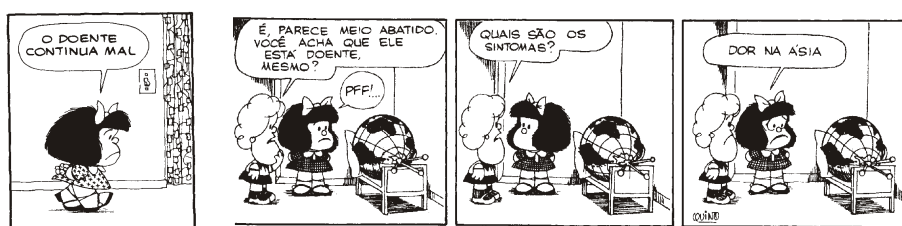
(LAVADO, Joaquim Salvador (Quino). Toda a Mafalda . São Paulo: Martins Fontes, 1993. p. 77.)

45. Leia a charge abaixo, que faz alusão aos conflitos no Oriente Médio: