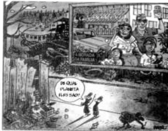
(VESENTINI, J. W.; VLACH, V. Geografia Crítica . São Paulo: Ática, 2005. v. 3, p. 42.)

03. Observe a figura abaixo, referente à apropriação do espaço urbano: