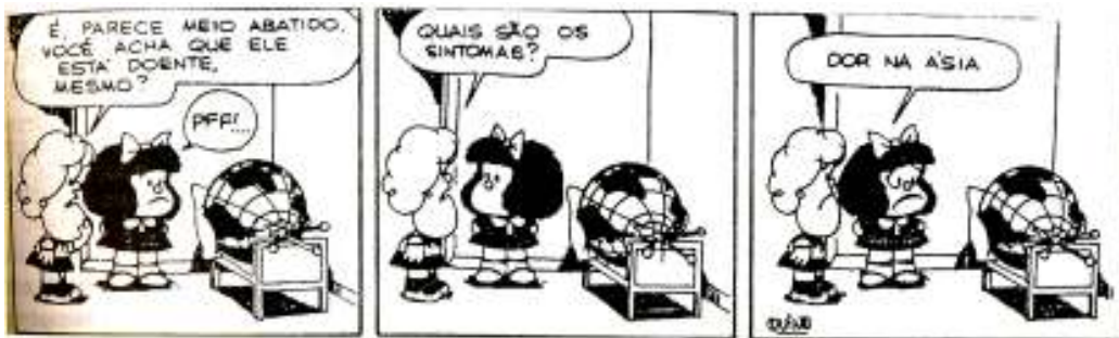
(QUINO. Toda Mafalda . São Paulo: Martins Fontes, 1995. p. 77.)

Tendo como base a tira e os conhecimentos sobre o tema, faça o que se pede: